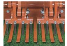
ターフリティナー