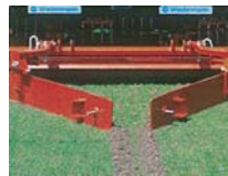
スワッシュボード