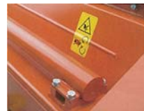
ヘビーデューティーウレイト