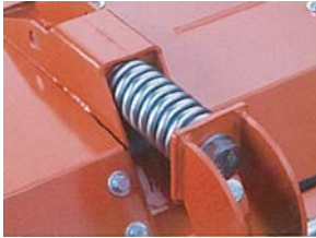
バイブラストップ