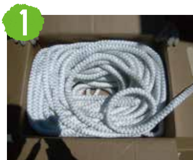
1 施工前に水を十分含ませておきます。