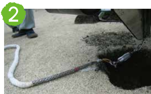
2 振動刃に弾丸を装着し、その先にPCドレネージを接続します。