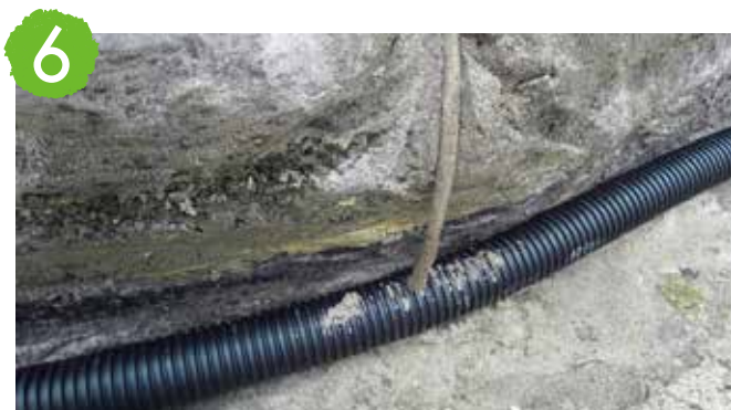
6 22mm程度の孔を開け、PCドレネージを管に差し込みます。接続高低差は最低15cm設けます。