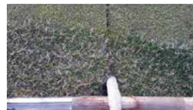
4 管挿入口の保護を行い、深度を確保します。