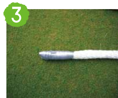
3 管の端はテープで塞ぎます。