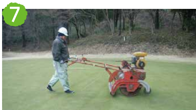
7 施工後、表面を均します。

芝管理機械を操作する前には必ずオペレーターマニュアルをよく読み、安全な操作およびメンテナンス方法を熟知してください。