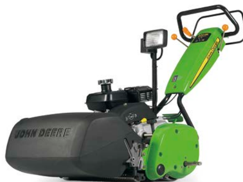
※グラスキャッチャーの色は仕様によって異なります。